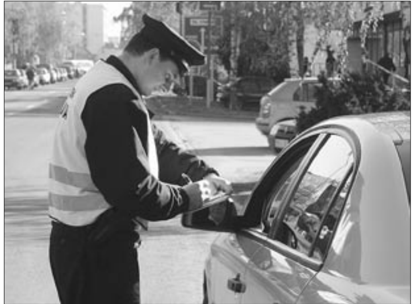
Akcia Jastrab na malacký spôsob – počet priestupkov riešených väčšinou blokovou pokutou sa vyšplhal na 38 s celkovou vyzbieranou sumou 16 600 Sk.