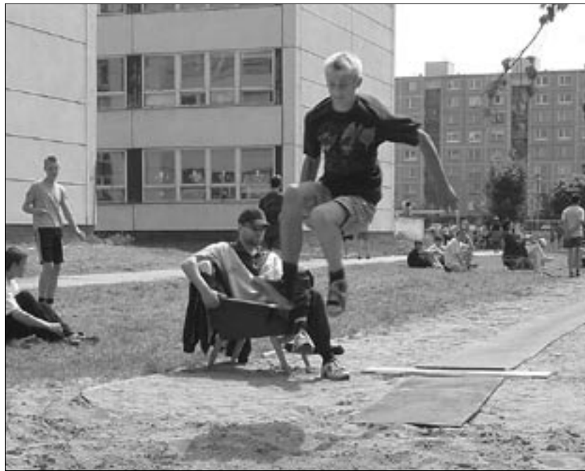
V ZŠ na Záhoráckej ulici sa to mladými športovcami len tak hmýri.