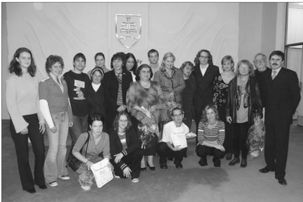
Umenie slova je záračné. Umožňuje nám urobiť viditeľným niečo, čo je hlboko ukryté v našom srdci či duši. Účastníci slávnostného popoludnia pri vyhlásení výsledkov literárnej súťaže Malacké brko 2004 sú na najlepšej ceste stať sa skutočnými majstrami tohto umenia, ktorého „diela“ sprevádzajú celý náš život. –lucy–