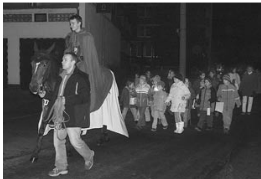
11. 11. zavítal do Malaciek v plnej zbroji Sv. Martin, aby sa s deťmi a ich rodičmi podelil o tradičné svätomartinské koláčiky a rozsvietil ich pripravené lampášiky či iné veselé svetlonosiče. O úspechu už druhého ročníka Svätomartinského sprievodu, ktorý organizuje OZ M.L.O.K., svedčil nielen huf účastníkov, no najmä svetielka v očiach a srdciach detí. Tie si všetci odnášali domov, aby jeho žiaru a teplo rozdávali ďalej.