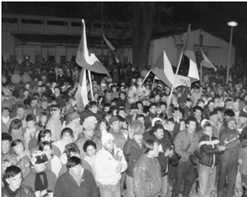
Nájdete sa? Zámocký park, november 1989.