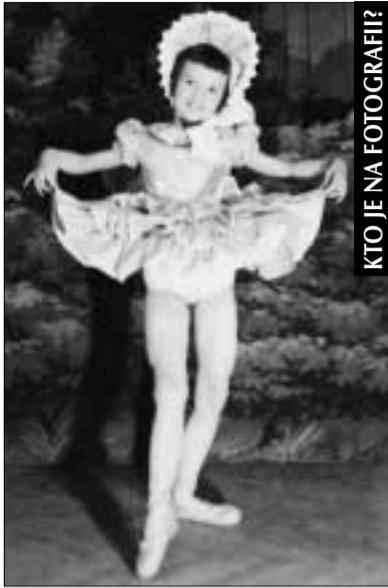
KTO JE NA FOTOGRAFII?

Radi sa pozeráte na vlastnú fotografiu z detstva, manželovu z vojenčiny alebo detí z pionierskeho tábora? Neváhajte, pošlite či prineste nám ju do redakcie (nepoškodená sa vám vráti naspäť). Oživte si spomienky s Malackým hlasom.