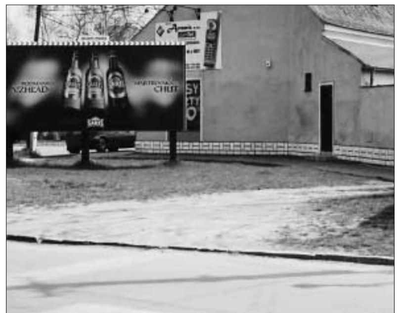
Centrum mesta prišlo o kúsok tak vzácnej zelene.