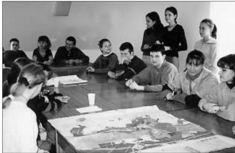
Dvere dokorán využili predovšetkým žiaci malackých škôl.