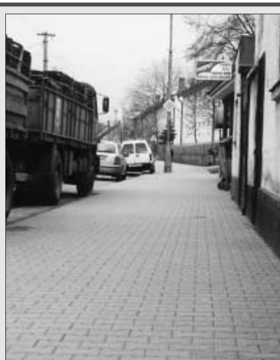
V rámci opráv a údržby zabezpečilo mesto výstavbu chodníka na Zámockej ulici i rekonštrukciu chodníka na uliciach Pribinova - 1. mája. Ďalším krokom ku skrášleniu mesta bude odvodnenie Pezinskej a Hlbokej ulice.