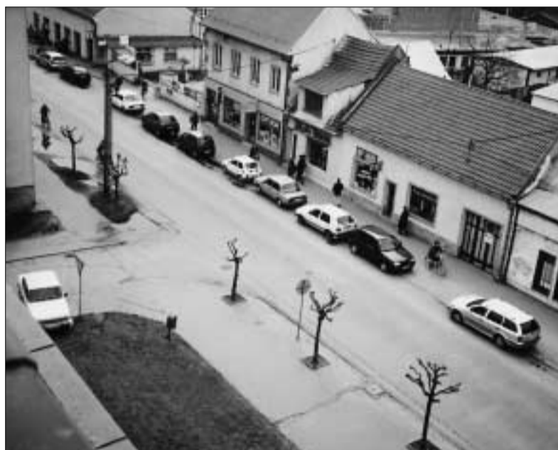
Zaparkovať na Radlinského ulici je večným problémom motoristov.