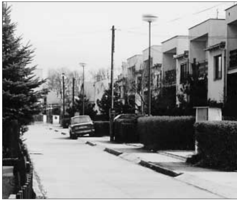
Poriadok a čistota vládnu uliciam tretieho obvodu s individuálnou bytovou výstavbou.