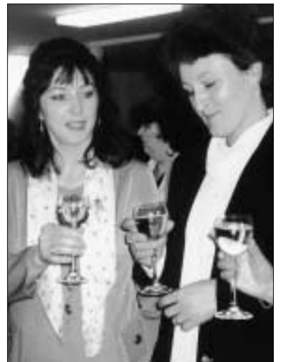
Bodaj by slovenské školstvo prekvitelo rovnako ako usmievané malacké učiteľky! Pokračovanie na 2. strane

Zastúpené boli všetky školy existujúce na území mesta. Týmto stretnutím chceli zástupcovia mesta pri príležitosti Dňa učiteľov pripomenúť dôležitosť a význam učiteľskej práce pre našu spo-