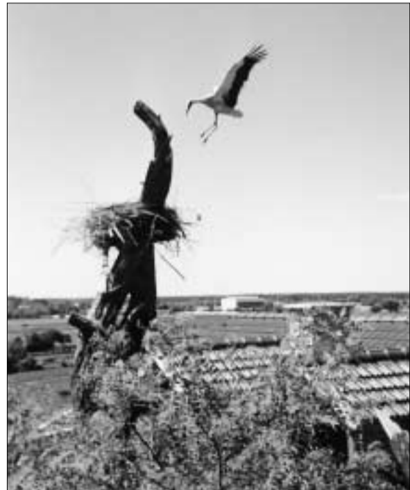
Bocian nalieta na pôvodné hniezdo.